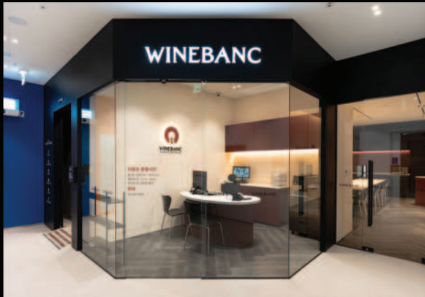
2023년 11월 와인뱅크 선릉역점 OPEN