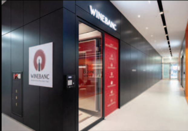
2023년 5월 와인뱅크 논현점 OPEN